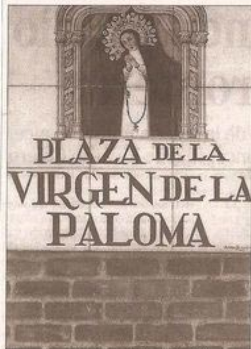
Mosaico de azulejos de un rincón emblemático.