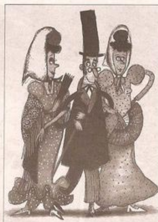
Por la verbena, del brazo de dos chulapas.